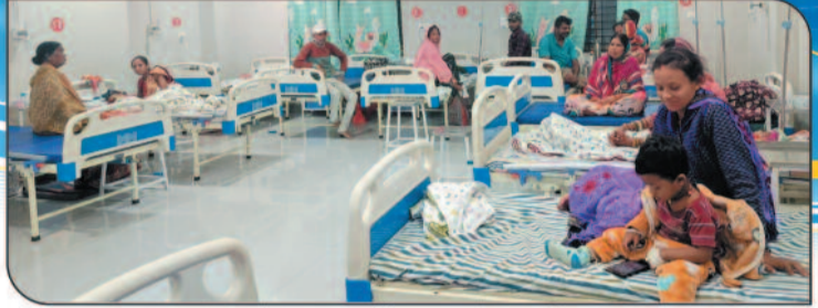
बच्चों के फ्रेक्चर, सर्जरी व ऑपरेशन की सुविधा सोनोग्राफी, एक्सरे एवं सभी प्रकार के पैथालॉजी जांच सुविधा उपलब्ध