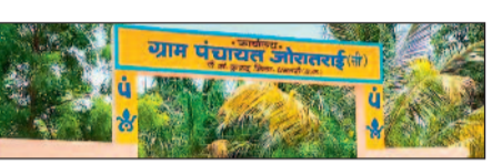
यथावत गंजीर/कुरुद। सरकारी योजनाओं की जमीनी हकीकत और कागजी ढावों के बीच की खाई कितनी गहरी है, इसका जीता-जागता उदाहरण ग्राम जोरातराई (सिलौटी) में देखने को मिल रहा है। वर्ष 2021 में लगभग 32 लाख रुपये की लागत से निर्मित पानी टंकी आज भी उपयोग के अभाव में शोपीस बनी हुई है। हैरानी की बात यह है कि पीएचई विभाग के रिकॉर्ड में यह परियोजना पूरी तरह सफल बताकर पंचायत को हैडओवर की जा चुकी है।