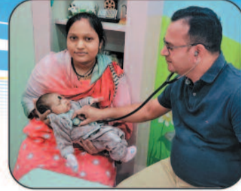
24 घंटे बच्चों के भर्ती व आपातकालीन इलाज