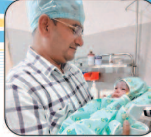
बच्चों के संपूर्ण टीकाकरण की सुविधा उपलब्ध